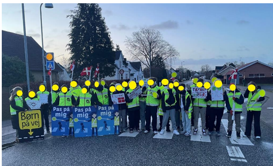
Billedet er fra "Den sureste uge" (uge 5) hvor politiet hylder skolepatrojlernes arbejde. Her i Herlufmagle på Susåskolen.